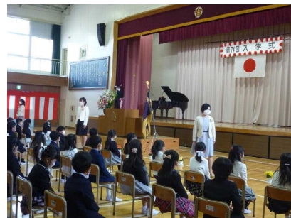
【わくわくドキドキ入学式】

幸町B, D, G 玉戸 一本松 鎌田 八幡台 谷島 上野殿 保護者送迎の児童(一部)