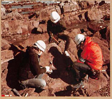
化石発掘のようす(ひたちなか市)

当館が実施している発掘調査のようすや道具など、化石が発見されて研究されるまでを紹介します。