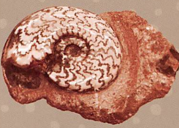
アンモナイト(アステロセラス)

化石記録からわかる生命の歴史について、各時代の主な古生物を多数の実物化石などを使って解説します。