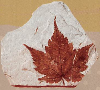
葉の化石(コミネカエデ)