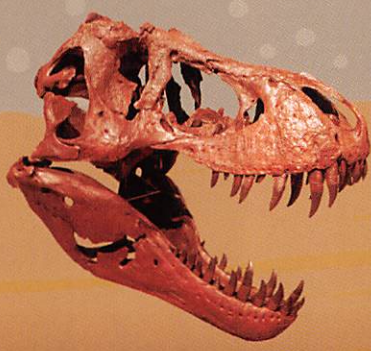
ティラノサウルス「スタン」の頭骨

有名なティラノサウルス「スタン」の産状レプリカ標本で、発掘現場の雰囲気を再現します。