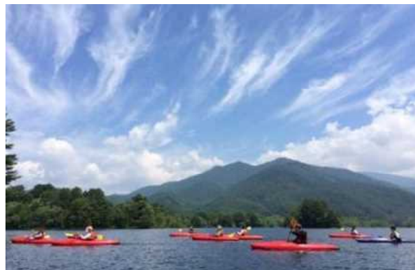
小野川湖 でカヌー体験！