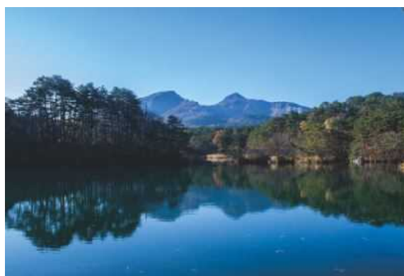
五色沼 ハイキング（毘沙門沼）