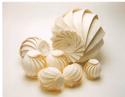
1枚の紙から作られる造形 「7 balls」2010年制作