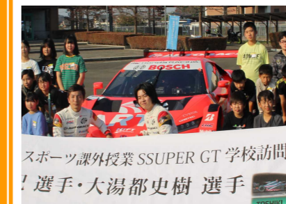
キャリア教育集会「夢工房」