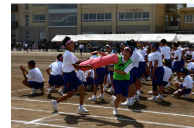
〔デカバトンリレー -西中の柱-〕