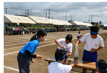
〔幸せいっぱい、水いっぱい〕