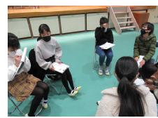
【グループディスカッション】