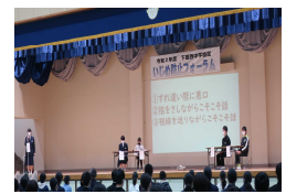
【パネルディスカッション】

下館西中の生徒会によって作成された動画から始まり、いじめについて全校生徒で考え、その意見を元に各校代表児童生徒のパネラーによるパネルディスカッションを行いました。その後、各校代表児童・全校生徒によるグループディスカッションを行い、いじめの人や傍観者の気持ちにも迫りながら自分事として捉えることができ、討論が深まりました。