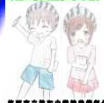
筑西市立協和中学校教育委員会

協和がよし国 どきわの住 筑西市立古里小学校 筑西市立新治小学校 筑西市立小黒小学校 筑西市立協和中学校