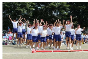
【昨年度の体育祭の様子】