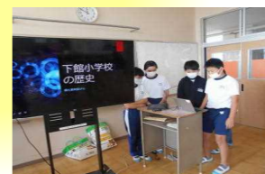
下館小学校の紹介