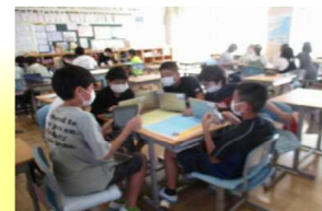
修学旅行の資料づくり