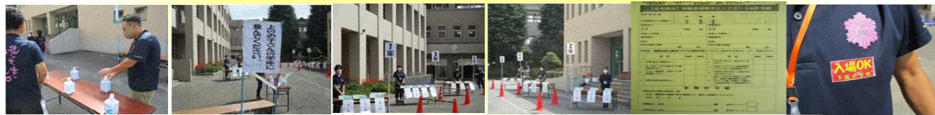
① ② ③ ④ ⑤