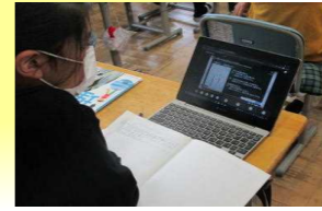
1台端末をもとに意見交換