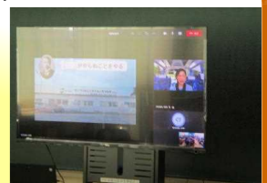
工場オンライン学習