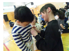
<里の子バッジの贈呈>