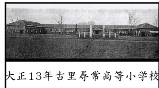
大正13年古里尋常高等小学校

さて、5月10日(金)は、創立記念日です。古里小学校は、明治7年桑山小学校、明治9年古郷小学校として、スタートしました。大正9年には古里尋常高等小学校となり、大正10年に知行の地に新校舎が建設され、創立記念日が制定されました。その後、古里国民学校、古里村立古里小学校、古里村立南小学校、協和村立古里小学校、昭和39年に協和町立古里小学校になりました。昭和45年に現在の場所(旧古里中学校跡地)に移転しました。昭和49年に、創立100周年記念事業を実施しました。そして、平成17年に筑西市立古里小学校になりました。この歴史と伝統のある学び舎に集う子どもたちが、笑顔で充実した楽しい学校生活を送れるように、全教職員で支援してまいります。地域の皆様、保護者の皆様、これからもご理解とご支援をお願いいたします。